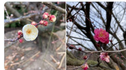
上: 昨年 3 月 15 日の様子