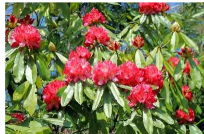
▲早咲きのシャクナゲ

※詳細はパンフレットをご覧ください。「赤塚グループ プレスリリース」で検索してご覧になれます