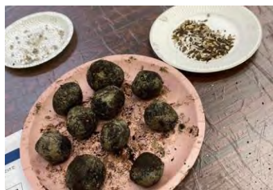
▲たねダンゴづくり