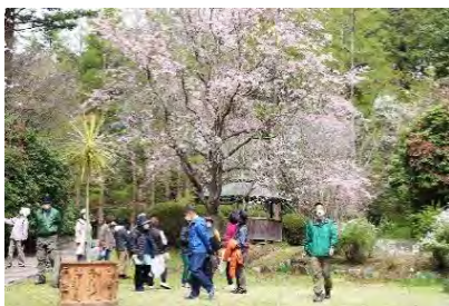
▲春の花を見て回るツアー

3月下旬からは様々な品種の桜やコブシ、モクレン、アカシアなどのほか、早咲きのシャクナゲが咲き始め、園内は一斉に春の彩りとなります。