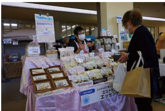
▲FFC すこやか物産展 (2022/11/7)