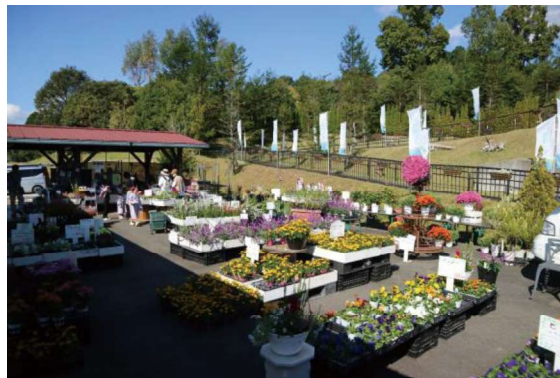
▲花とみどりのマルシェ (2022/11/3)