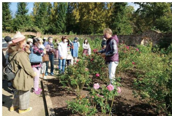
▲ローズガーデンガイドツアー (2022/11/5)