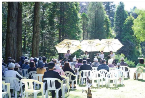
▲森のコンサートの様子 (2022/11/7)