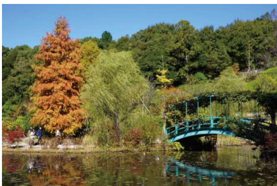
▲ラクウショウの黄葉 (2022/11/7)